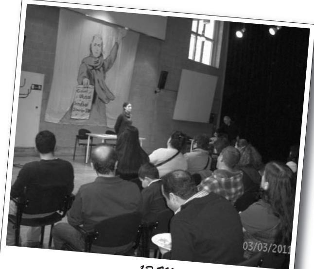
13 Mart 2011 | Stuttgart

Saat 18.00'de şehrin en işlek yeri olan alışveriş merkezine doğru bir yürüyüş yapıldı. Coşkulu sloganlar ve ajitasyon konuşmaları eşliğinde yapılan yürüyüş, çevrede bulunan insanlar tarafından ilgi ile izlenildi. Kısa bir güzergah dolaşarak, tekrar alana döndü. Burada, etkinliği düzenleyen kurumlar adına