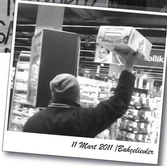
11 Mart 2011 | Bahçelievler

Ontex-Canbebe işçileri Taksim eylemlerinin üçüncü haftasında boykot çağrılarını yinelediler. 12 Mart akşamı, Ontex'in de sahibi olan Goldman