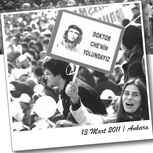
13 Mart 2011 | Ankara