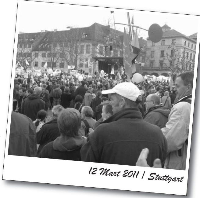
12 Mart 2011 | Stuttgart

Bochum'da gerçekleştirilen protesto eylemi Rathaus-Belediye binasının önünde başlatıldı. Gösteriye binin üzerinde kişi katıldı. Esas olarak