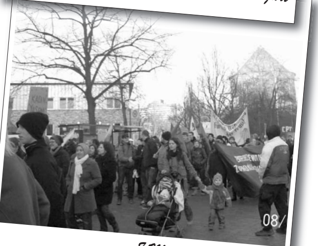
8 Mart 2011 | Hamburg