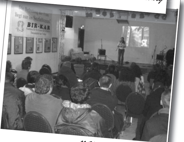
11 Mart 2011 | Bielefeld

konuşmalar yapıldı. Programın bu bölümünde, BİR-KAR Gençliği'nin hazırladığı politik Rap türü müzik dinletisi katılımcılar tarafından coşku ile karşılandı. İntifada Grubu'nun başarılı biçimde gerçekleştirdiği bu dinleti, ilgi çekti, birçok genç insanın etkinliğine katılmasına da vesile oldu.