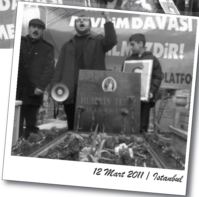
12 Mart 2011 | İstanbul